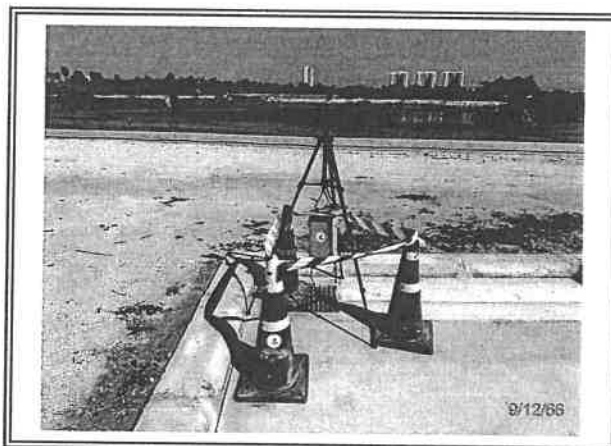
รูปที่ 2 ระดับเสียงทั่วไป 24 ชั่วโมง บริเวณพื้นที่โครงการ ระหว่างวันที่ 9-12 ธันวาคม พ.ศ.2566